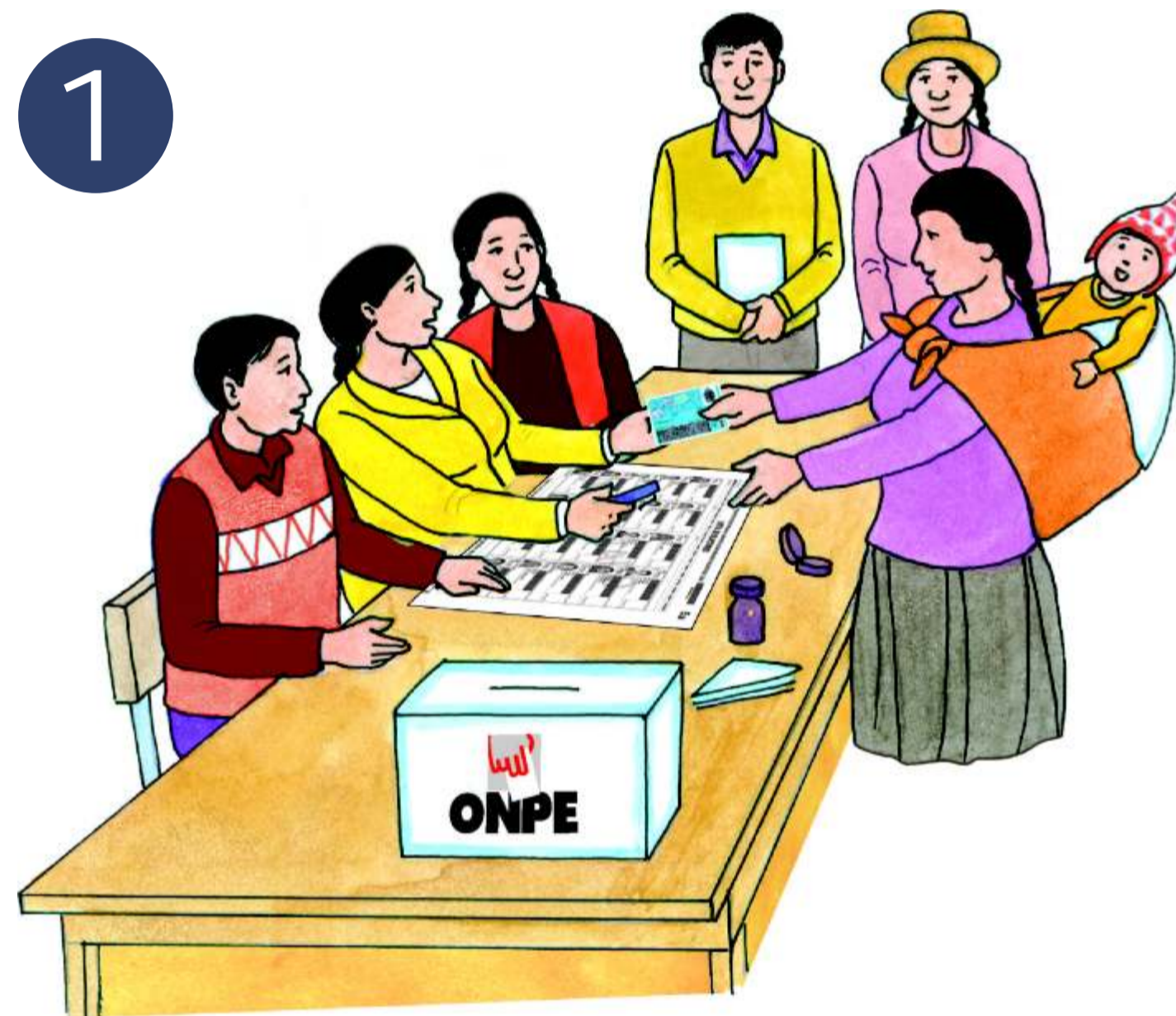
1 Presenta tu DNI al Presidente de Mesa.