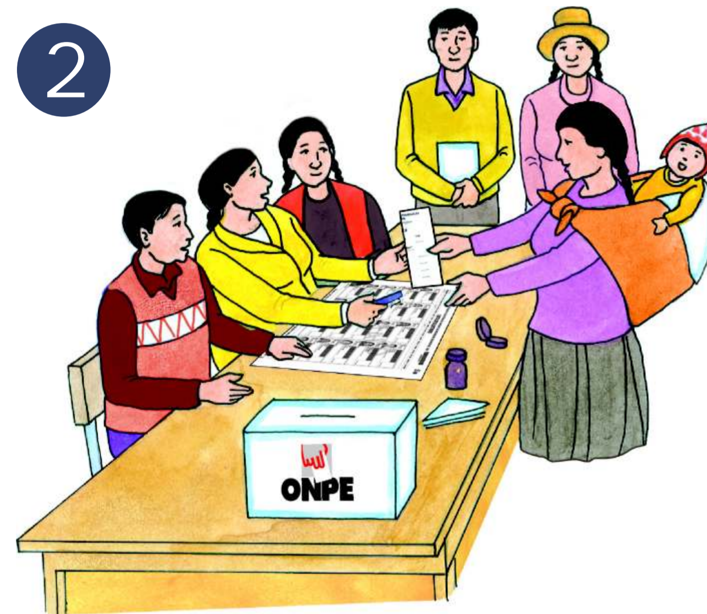
2 Recibe la cédula de votación firmada por el Presidente de Mesa.