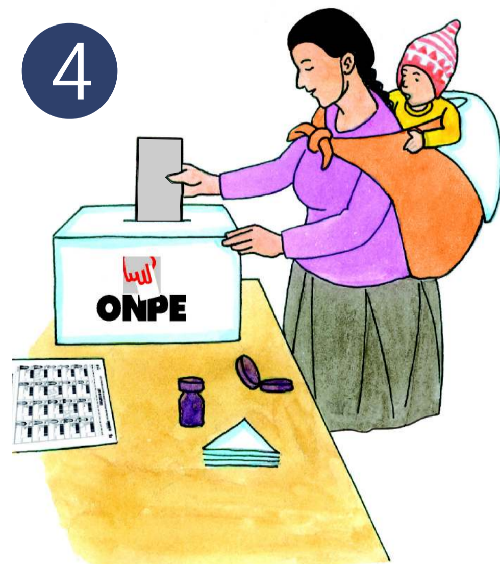
4 Deposita la cédula doblada en el ánfora.