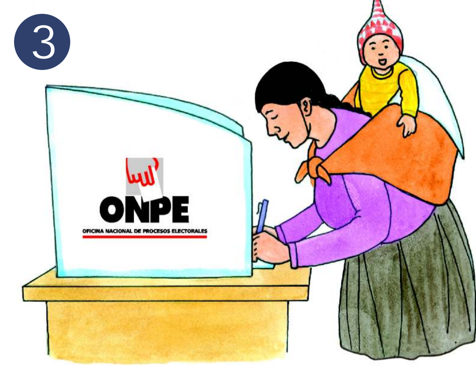
3 Ingresa a la cámara secreta y marca tu voto (SI o NO) en la cédula de votación por cada una de las autoridades en consulta.