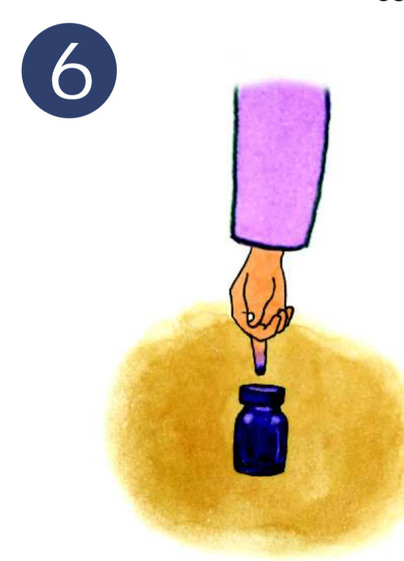
6 Introduce el dedo medio en el frasco de tinta indeleble.