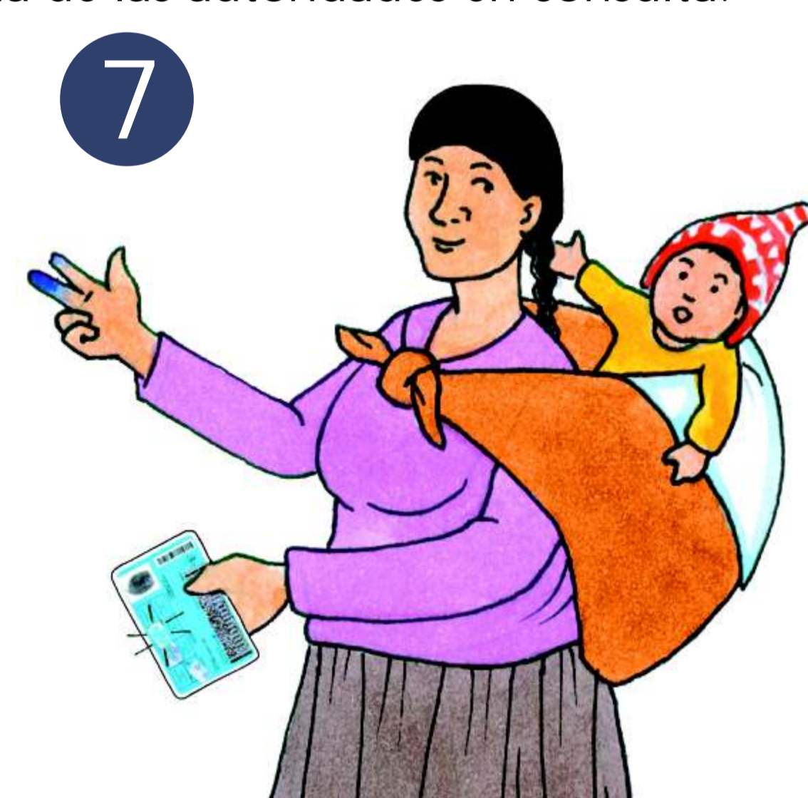
7 Verifica que el Miembro de mesa haya pegado el Holograma en tu DNI.